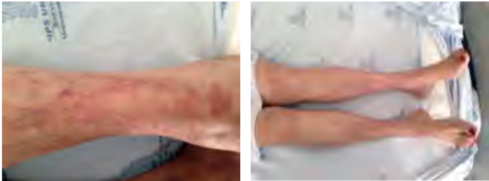
Figura 3. Paciente con síndrome DRESS por furosemida, la cual se reactivó luego de la resolución de los síntomas iniciales al tener contacto nuevamente con el medicamento. Diagnóstico diferencial urticaria vasculítica. Paciente del Servicio de Alergología Clínica de la IPS Universitaria, Universidad de Antioquia. Medellín, Colombia.

Actualmente no existe un diagnóstico estandarizado. Antes de confirmar el DRESS se deben descartar otras condiciones como infecciones, procesos neoplásicos y desórdenes tanto autoinmunes como enfermedades del tejido conectivo [66]. Debido a las lesiones en piel de características variables el DRESS puede asemejarse a diferentes condiciones que hacen difícil el diagnóstico oportuno (véase figura 3 ) [53].