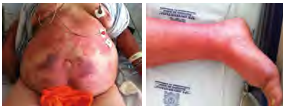
Figura 2. Paciente con síndrome de DRESS del servicio de Alergología Clínica de la Universidad de Antioquia. Medellín, Colombia.

Las manifestaciones típicamente se desarrollan dos a ocho semanas después de iniciar el medicamento causal y pueden persistir a pesar del retiro de este [52]. La fiebre suele preceder a los síntomas cutáneos, los cuales son variables; sin embargo, el exantema morbiliforme es el más común y se caracteriza por ser difuso, pruriginoso, macular y en ocasiones con eritrodermia. Estas lesiones pueden progresar y comprometer gran parte de la superficie corporal y resultar en una dermatitis exfoliativa (véase figura 2 ) [53]. Los síntomas pueden estar acompañados de edema facial en el 50% de los casos [69].