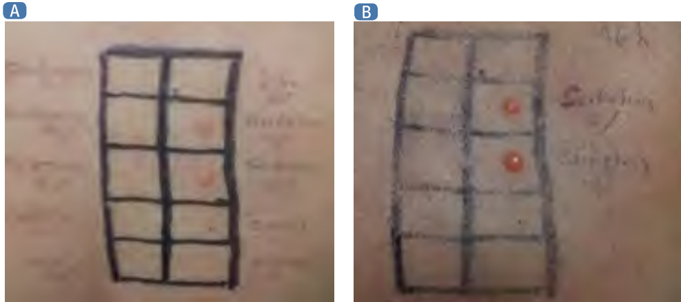
Figura 4. Paciente de 45 años con síndrome de DRESS en el contexto de consumo de litio y sertralina. Se le realizó prueba de parche con quetiapina en petrolato al 5% y 10%, litio en petrolato al 5% y 10%, sertralina en petrolato al 5% y 10%. A. lectura a las 48 horas. B. Lectura a las 96 horas, positivo para sertralina. Medellín, Colombia.