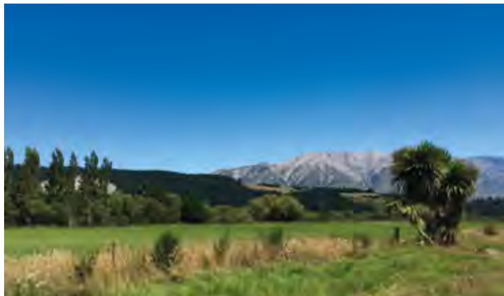
Lake Tekapo. New Zealand.